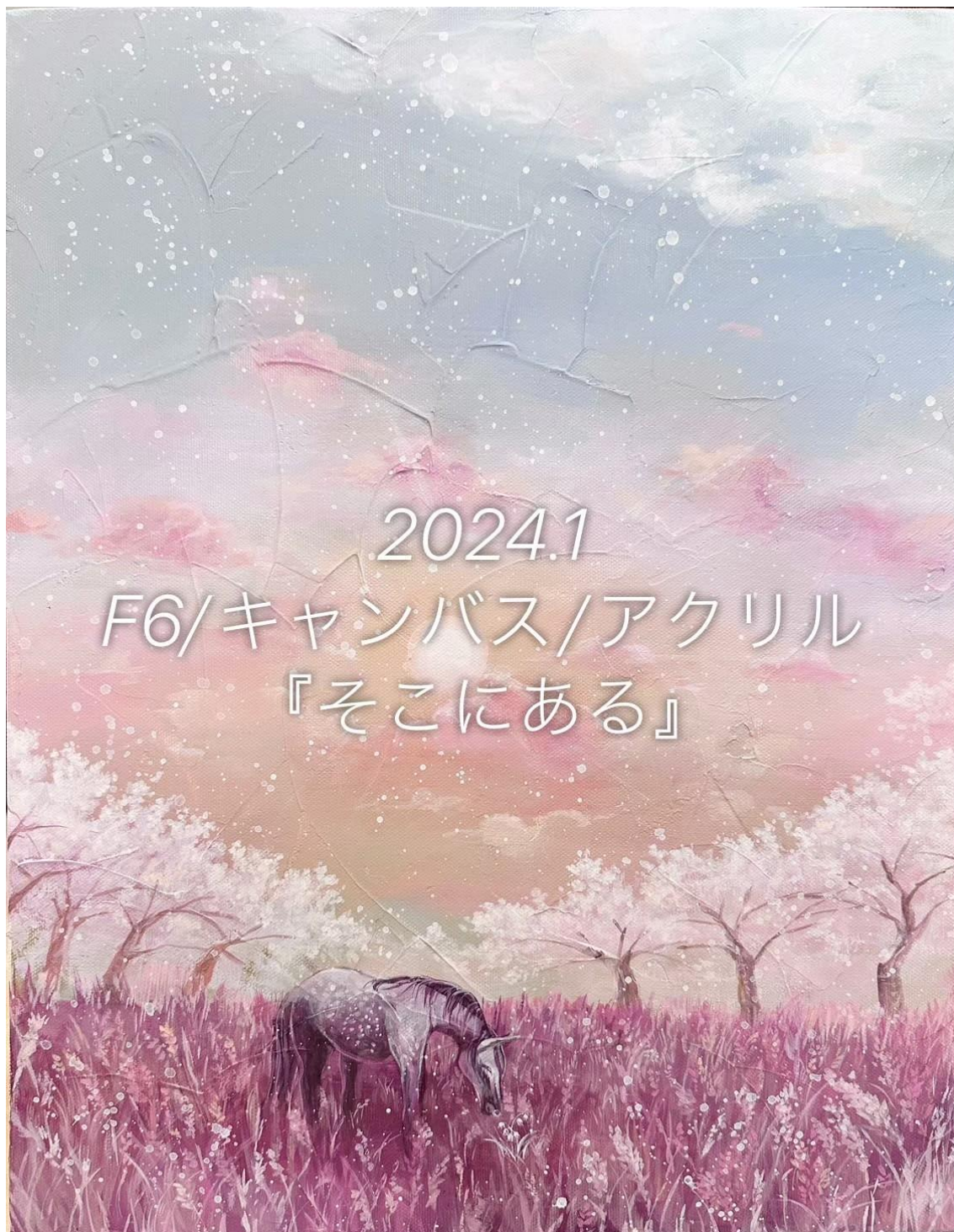
F6/キャンバス/アクリル『そこにある』

あそこにあるかもって遠くを見るけど、大抵、大切なことは近くにある。慌てて何も見えなくなった時は、一息ついて足元を覗いてみて欲しい。