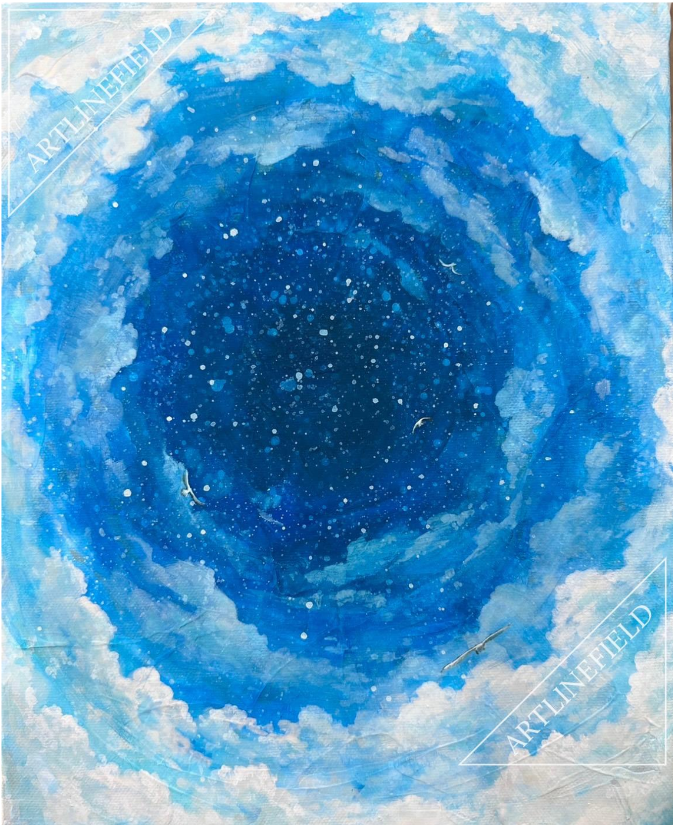
『sky high ～冒険～』 F3