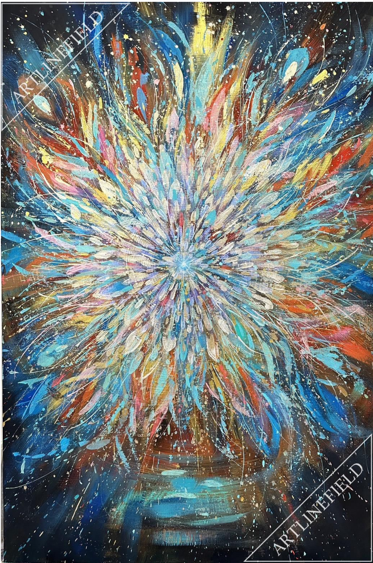
『風鎮雀 (かぜすずめ)』M30 (原画)