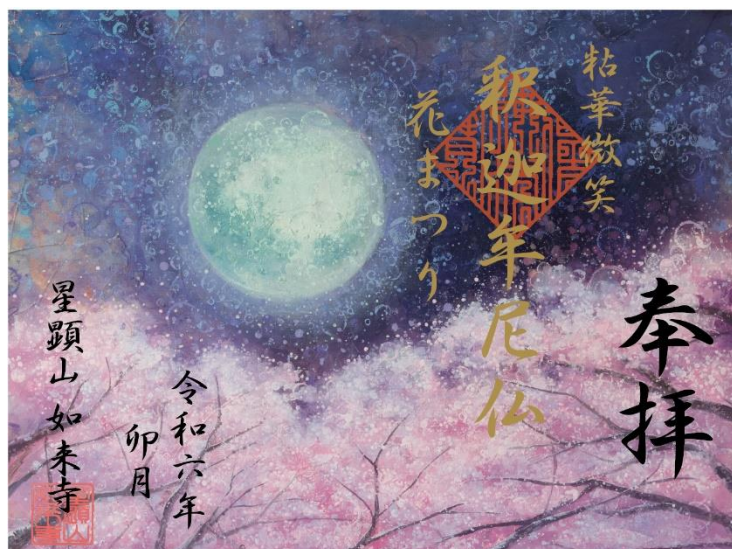
『夜桜月徒』 F10 アクリル ring

季節が目まぐるしく移ろう故に、 徒然る間も無い。 夜桜を眺めては気が乱れ、 月を見てはまた気が乱れ、 狂おしい夜にただ眩暈がする。 私は季節の信徒のようです。