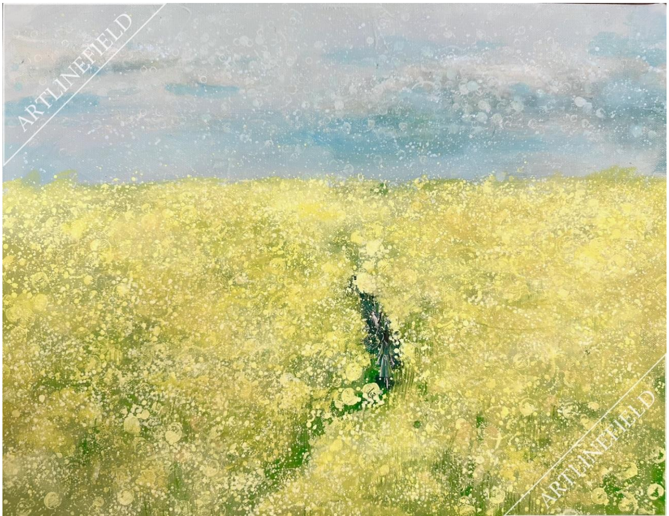
『ねこと散歩～菜の花と～』 F6 アクリル ring