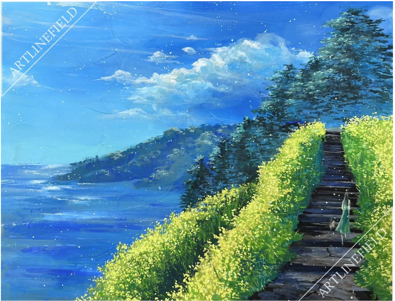
習作『ねこと散歩～江ノ浦測候所～』F6