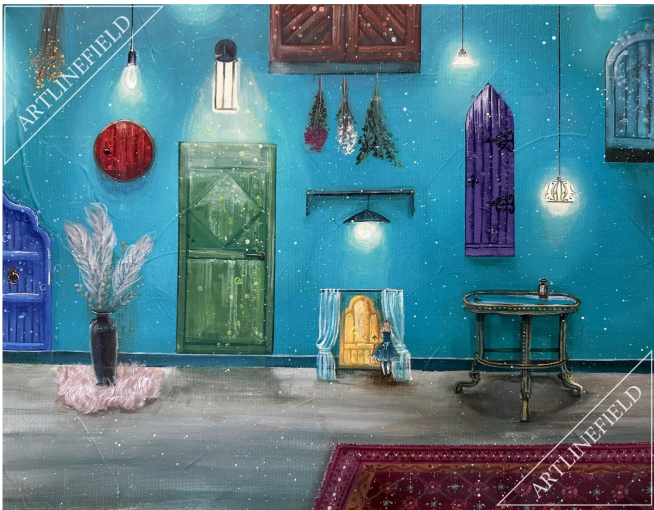
『What a mess!』 from alice in wonderland (Acryl F6)