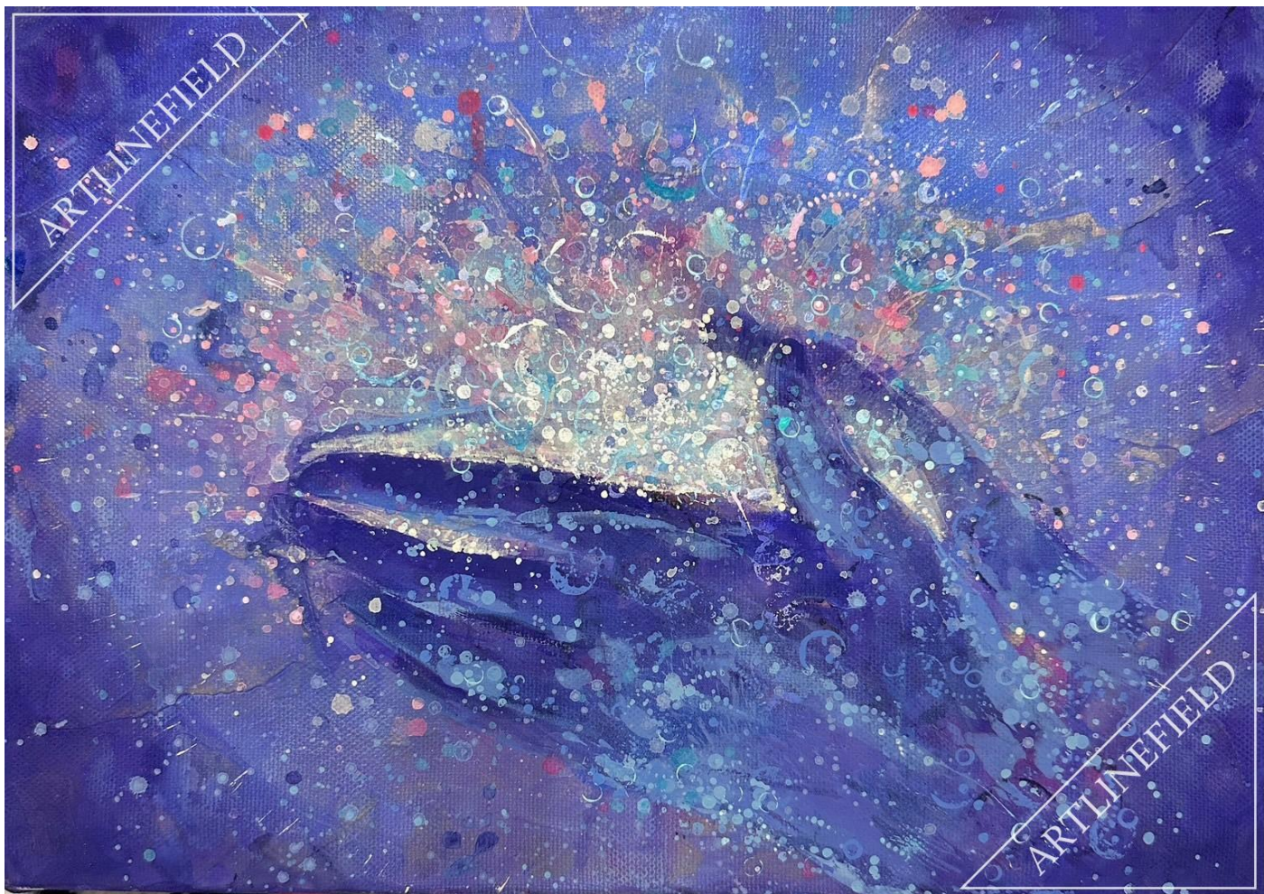
P3/キャンバス/アクリル『法』 Ring を使用