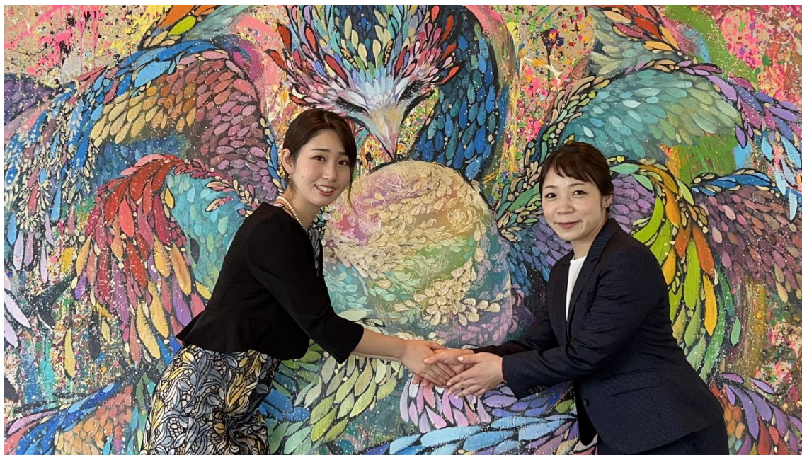
三宅 宏実（日本女子最多に並ぶ5大会連続オリンピック出場選手）さんと（F200）