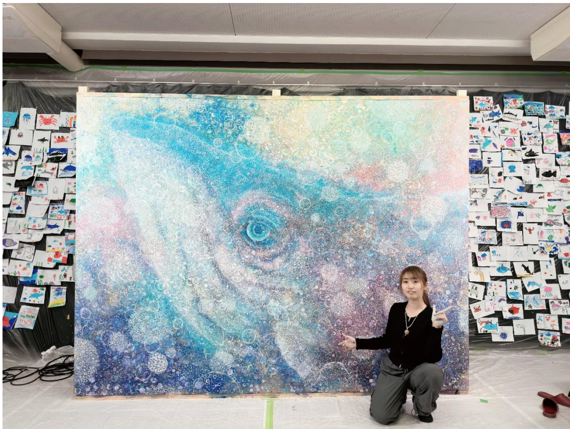
「親子2000人と描く大点描画」8日間に及び、記念行事作品を親子2000人と描きました。（F300）