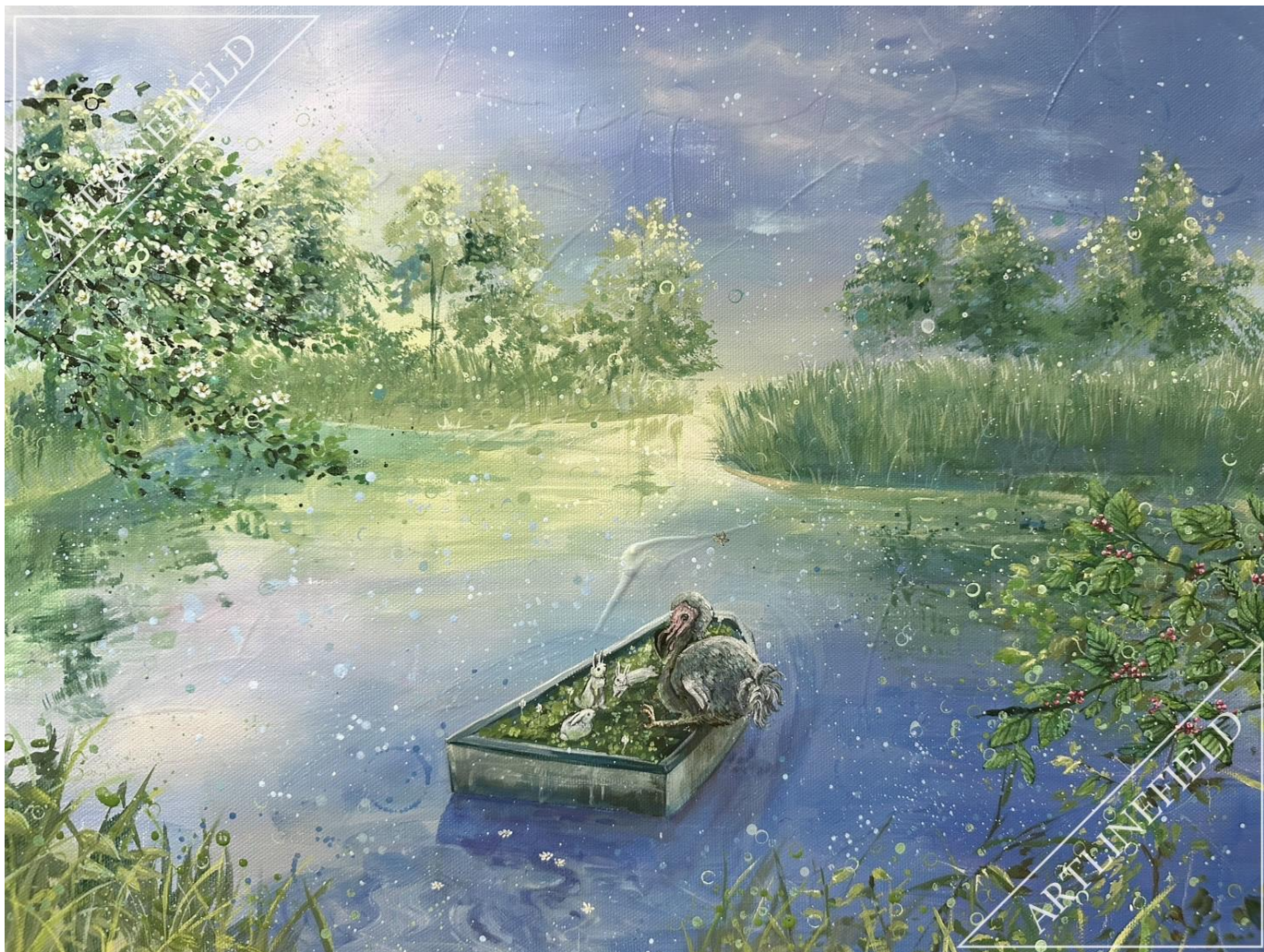
『NONSENSE~alice in wonderland~』(F6 アクリル)

「でたらめをいれること！」不思議の国のアリス冒頭場面、子ども達がお話を求める場面より。人ではなくて、動物達に置き替えて、この物語をもっともっとうい加減に描いて作品にしてみたくまりました。